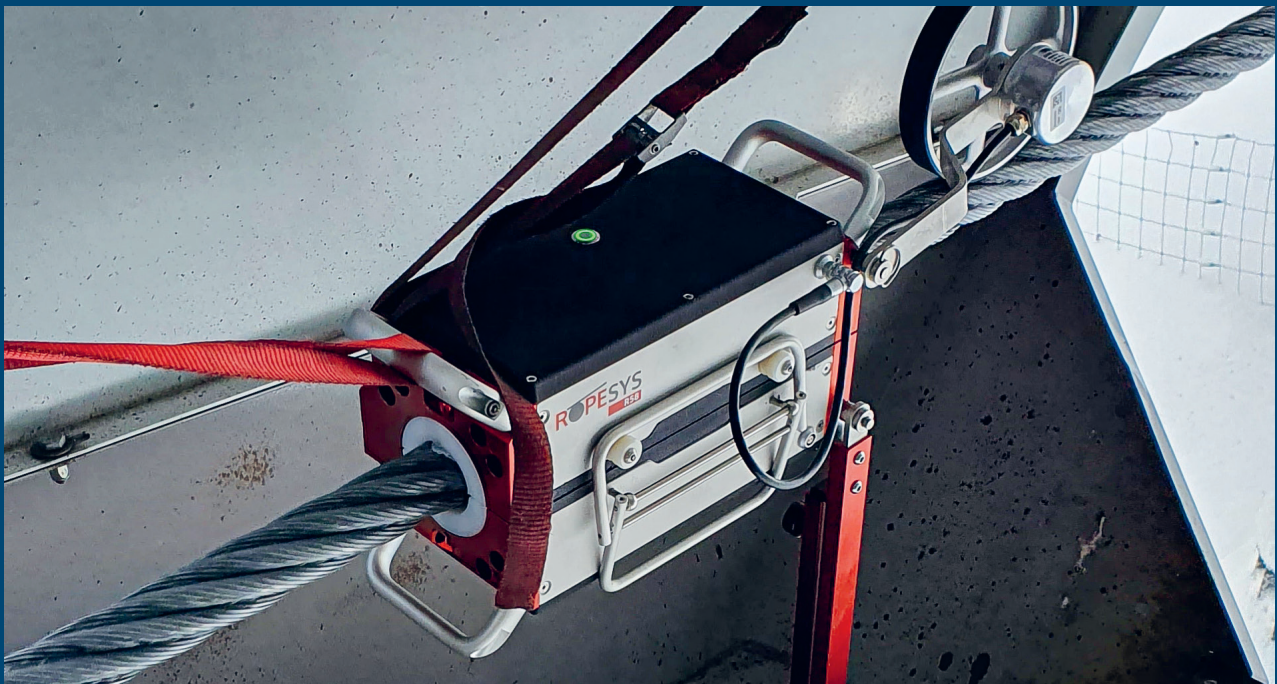
Magnetinduktive Seilprüfung IWM AG