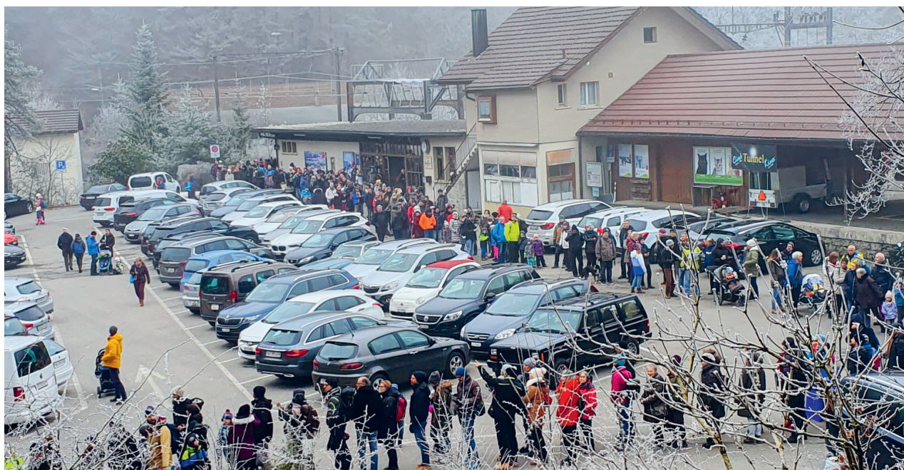
Grossaufmarsch am Berchtoldstag 2020 / Frequenz 7'300 transportierte Personen berg- und talwärts