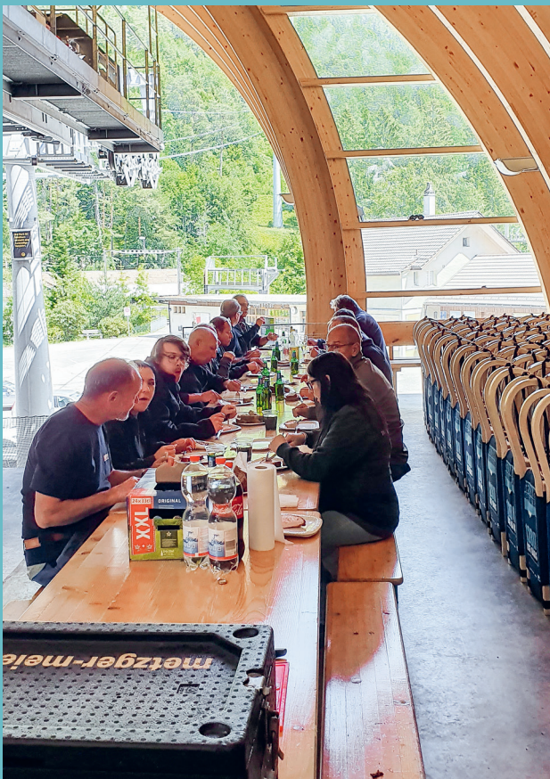
Im Mai 2020, Belegschaft im «Corona Lockdown»